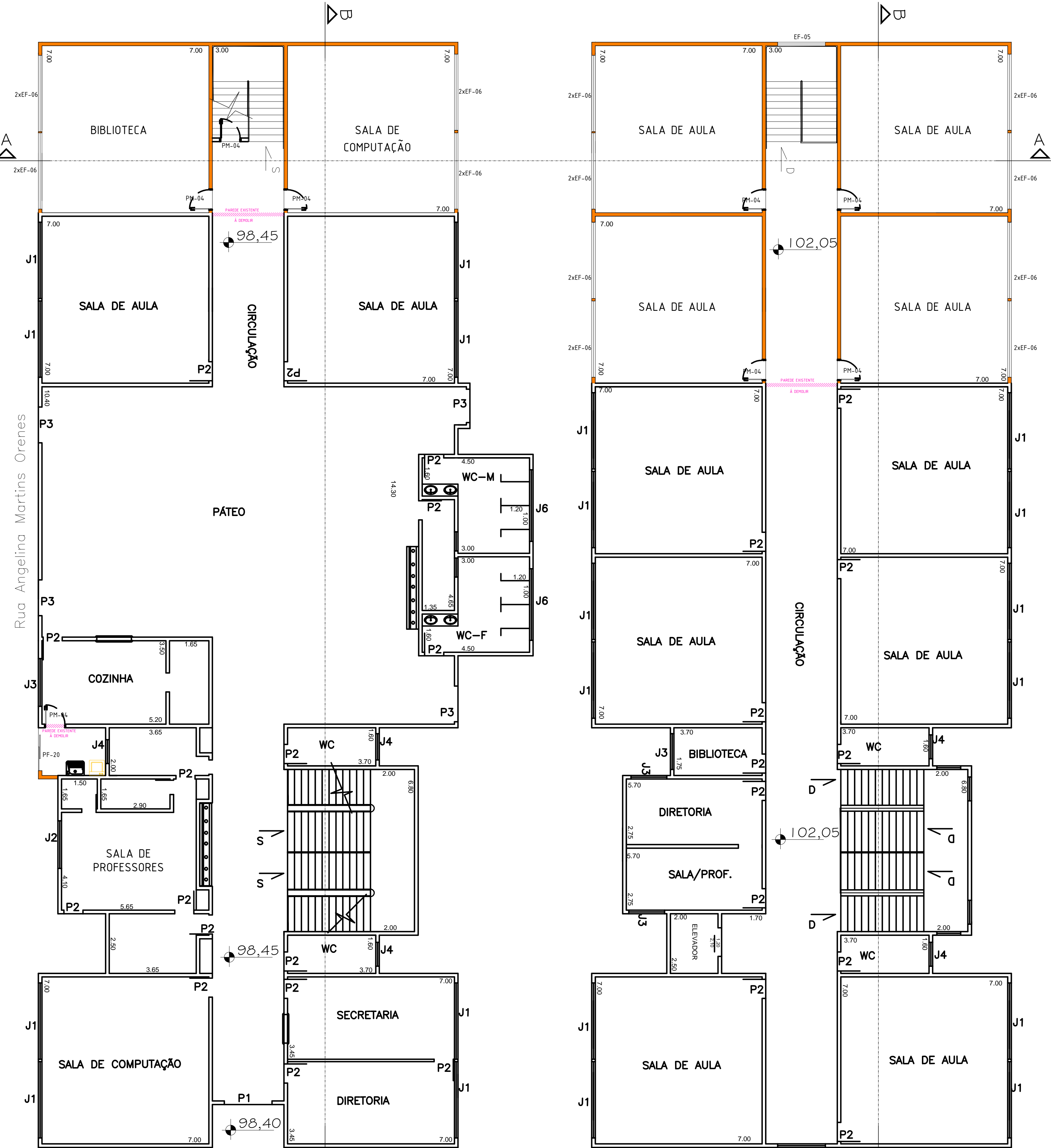
PAVIMENTO TERREO Esc. 1:100